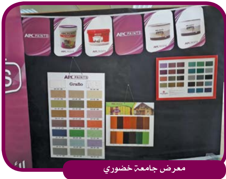
معرض جامعة خضوري