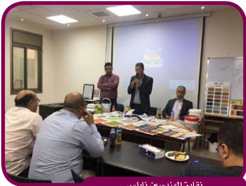
نقابة المهندسين نابلس