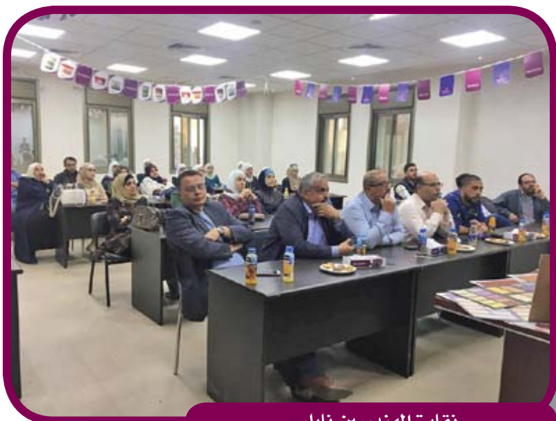
نقابة المهندسين نابلس