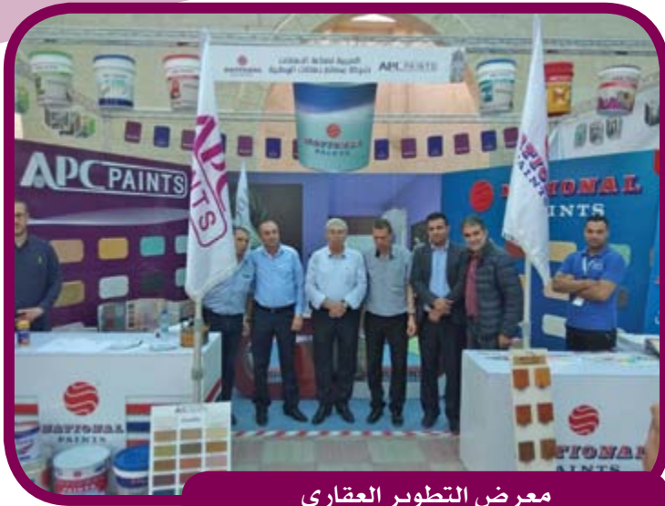
معرض التطوير العقاري